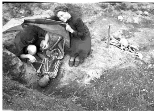
Linksmučių (Pakruojis r.) kapinyno kasinėjimai 1949 m.

Archeologinių kasinėjimų nuotraukos atskleidžia Lietuvos archeologijos istoriją ir pagrindines 1948-1969 m. kasinėtas archeologines vietas. Vaizdai parodo archeologinių ekspedicijų kasdienybę, 20 a. viduryje mūsų archeologų taikytus metodus bei naudotus įrankius, o taip pat supažindina su pagrindiniais žymiausiais to meto Lietuvos archeologais.