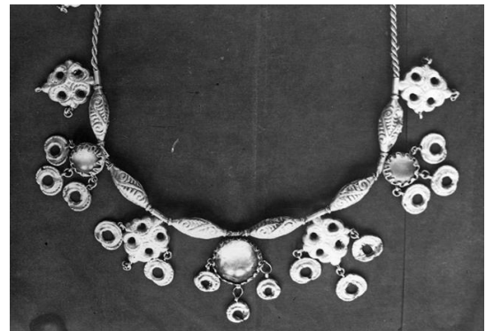
Sidabrinis vėrinys rastas 1950 m. (radimvietė nežinoma).

Archeologinių radinių nuotraukos sudaro kitą svarbią kolekcijos dalį. Čia galima išvysti retus ir išskirtinius archeologinius artefaktus, kurie buvo surasti kapuose, piliakalniuose, gyvenvietėse ir kituose archeologiniuose objektuose.