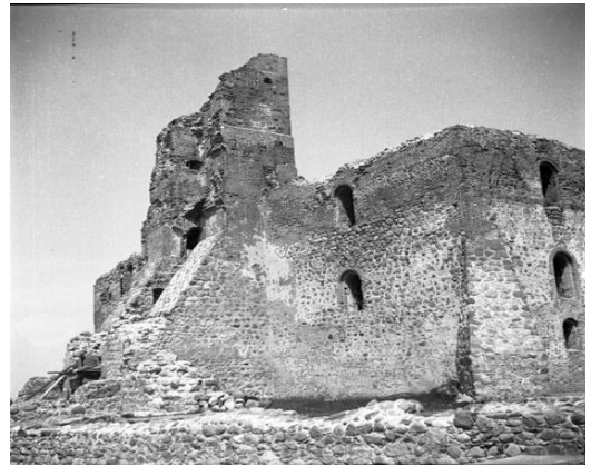
Trakų rezidencinė pilis 1954 m. prieš restauraciją.

Archeologinių vietovių, paminklų ir istorinio kraštovaizdžio nuotraukos vaizduoja pagrindinius Lietuvos Akmens, Bronzos, Geležies amžiaus paminklus ir reikšmingiausius Viduramžių (13-16 a.) objektus: Valdovų rūmus ir Vilniaus Žemutinę pilį, Kauno pilį, Trakų rezidencinę pilį bei kt. Panoraminiai vaizdai taip pat išsaugojo išnykusį unikalų mūsų šalies kraštovaizdį.